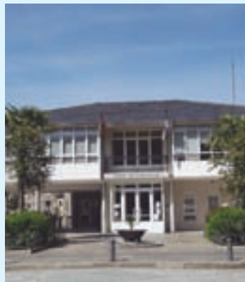
Concello de Samos

Entre os proxectos previstos para a presente anualidade, o goberno local salienta a construción dunha praza ao carón do paseo do mosteiro co fin de dar un maior pulo ao Camiño Francés na localidade. O Concello traballa