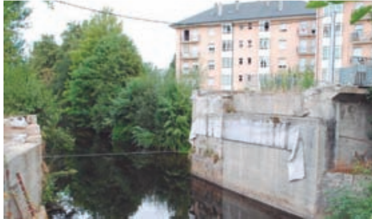
Vista da Ponte Ribeira

O Concello de Sarria presentaba en decembro de 2019 o proxecto para a construción dunha pasarela metálica provisional no viaducto. Para levalo a cabo, e conforme á legalidade esixida, solicitaba en xaneiro de 2020 o informe/autorización pertinente á Dirección Xeral de Patrimonio Cultural, en febreiro á Confederación Hidrográfica do Miño-Sil (CHMS), e en novembro á Deputación de Lugo. Tanto a Deputación como a Confederación Hidrográfica emitían informes favorables á obra, non sendo así no caso da Dirección Xeral de Patrimonio, que non se pronunciou ao respecto ata un ano máis tarde -o día primeiro de marzo de 2021- cun