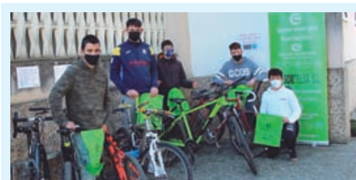
Participantes na campaña do IES Afonso Xograr

Debido a situación do covid-19, tanto na aula como nos espazos manteranse as distancias de seguridade, ademais doutras medidas e protocolos con carácter obrigatorio.