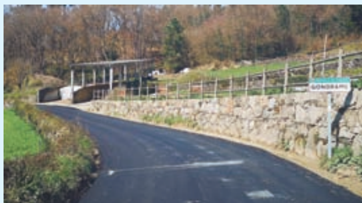
Imaxe da entrada ao núcleo de Gondrame

O Concello está a executar obras de acondicionamento na vía de acceso ao núcleo de Gondrame. Os traballos contan cun orzamento de 52.000 euros con cargo ao Plan Único de 2020.