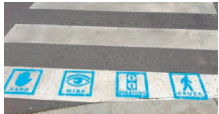
Os novos pasos de peóns en Sarria

As persoas que opten por esta ruta alternativa deben tomar fotografías e/ou gardar o percorrido a través dalgunha aplicación para medir a actividade e, deste xeito, poden recibir tamén os seus agasallos.