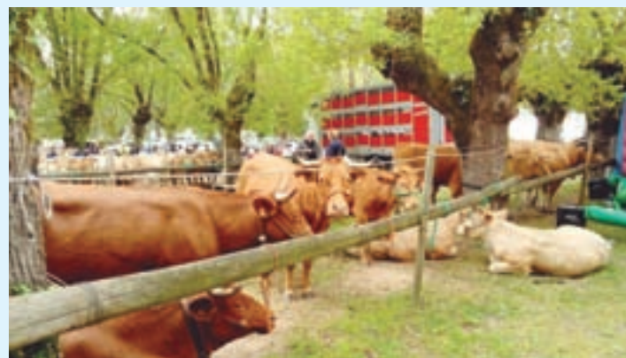
Imaxe da feira doutros anos

Láncara non celebrou o pasado 1 de maio, e por segundo ano consecutivo, a súa tradicional Feira Degustación de Tenreira Galega, a que sería a súa vixésimo segunda edición. Ante esta situación, o Concello quixo achegar a feira ás casas dos veciños e veciñas e, para iso, repartiu de xeito gratuito