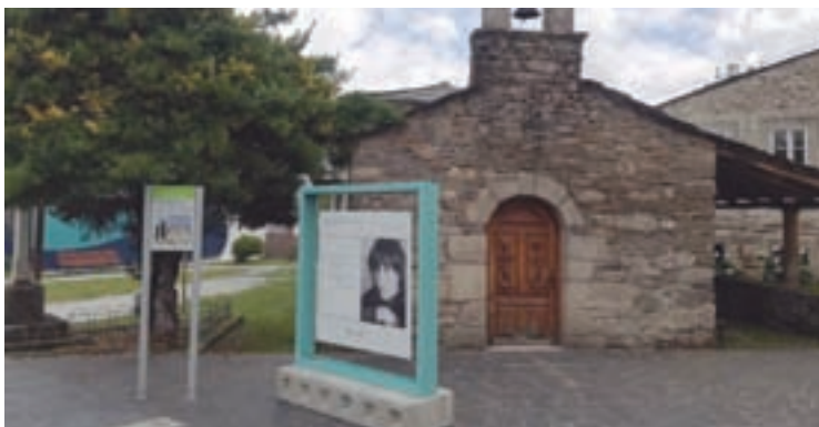
Un dos paneis coa imaxe de Xela e o seu texto poético

Os retratos recollen a vontade creativa e os pactos estéticos do fotógrafo e da poeta, que non só se amosa como modelo, tamén como creadora, tal e como explicou na presentación da mostra Xulio Gil. “Hai moi poucas fotografías que sexan roubada, que sexan do doméstico, en xeral, son fotografías recollen posturas ou posados nos que ela controla a imaxe que quere transmitir”, sinalou o