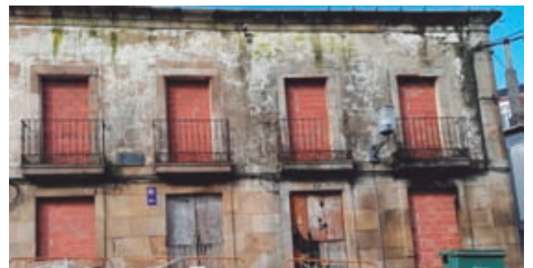
Estado de deterioro da Casa dos Ulloa

Esta manifestación provocou o rexeitamento dos demais grupos da corporación municipal, ao entender que a colocación desas lonas conlevará que o edificio non se restaure durante o actual mandato. O rexedor sarriano recoñeceu que a restauración da Casa das Arsenias non é a día de hoxe