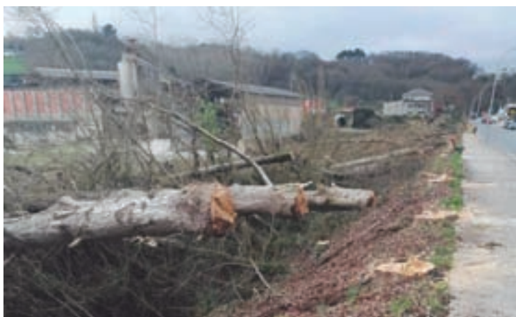
Restos da poda na rúa Castelao

A liña eléctrica de Oural soterrouse no ano 2015, cando se solicitou a subvención. Era unha obra moi demandada polos veciños, polo perigo que a liña podía supoñer ao pasar ao carón dos xogos infantís e do parque biosaudable da localidade. Coa perda agora da subvención, o Concello de Sarria terá que asumir o coste das obras.