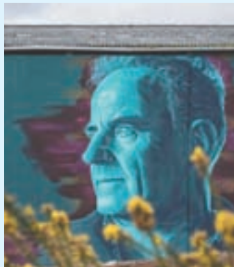
Un dos murais do Camiño francés

As Estrelas do Camiño encádrase nas últimas etapas do Camiño Francés: Triacastela, Sarria, Portomarín, Melide, Arzúa, O Pino e Santiago de Compostela. Cada unha destas etapas conta cun