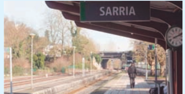
Estación de tren de Sarria

Adif vén de aprobar a licitación das obras de tratamento de plataformas e cruces entre plataformas en catro estacións do tramo Monforte de Lemos-Lugo, da liña convencional León-A Coruña, por un importe de 4.423.130,56 euros. Os traballos forman parte dos proxectos de modernización do tramo Monforte-Lugo e permitirán mellorar a seguridade de circulacións e usuarios. Á súa vez servirán para adaptar os elementos obxecto deste contrato ás novas condicións de explotación que traerá consigo a electrificación a 25 kV do tramo Monforte-Lugo.