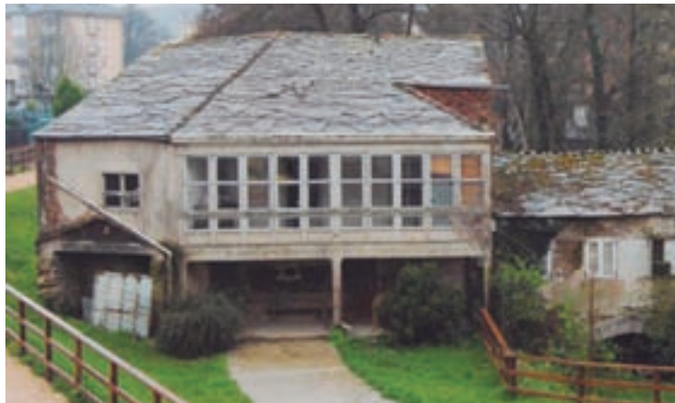
Imaxe do Muíño do Toleiro

Foi rexeitada tamén outra moción do PP para pedir explicacións sobre a perda de 450.000 euros de fondos do plan único dos anos 2017 e 2018.