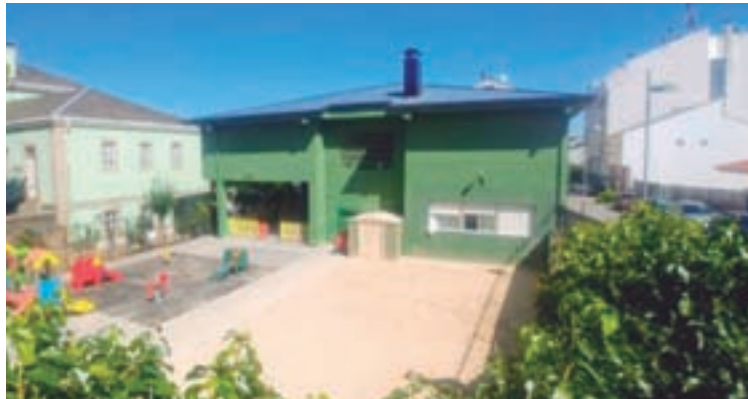
Vista da Escola infantil

Tras os trámites comezados en xaneiro por parte do Consello Escolar, a Administración autonómica publicou a resolución no DOG (Diario Oficial de Galicia) para por en vigor o novo nome. A noticia foi acollida con alegría ante a rapidez do proceso. Así mesmo, a solicitude do cambio de denominación realizouse debido ao exemplo de solidariedade da propia Xela Arias. Tamén se definiu como “unha persoa socialmente comprometida” e “precursora do feminismo na literatura galega nos 90”. Ademais,