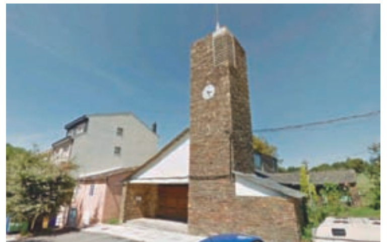
Fachada da igrexa de Santa Cruz

samáns do coro, realizado con tubos de aceiro de sección cadrada como os das cercas, en que se enroscan 13 táboas de castiñeiro; o lintel da porta da sancristía; as portas- con seccións macizas de madeira, e ferraxes feitos