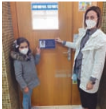
Unha das placas colocadas no colexio