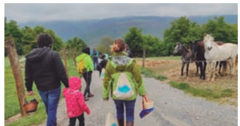
A primeira actividade foi un curso de iniciación aos cogomelos

A Deputación porá a disposición da veciñanza da provincia un total de 17.000 Bonos Impulso.