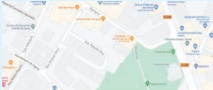
Zona onde se prevé o aparcadoiro no Pedregal