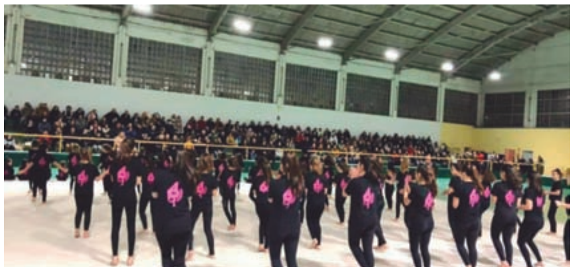
Arriba, as adestradoras de Xirandela e, abaixo, unha das súas actuacións

portes que máis licencias federativas ten, pero o que si lle ocorre é que non ten a mesma repercusión nos medios que outros, aínda que melloramos moito, e iso fai que sigamos á sombra de moitos outros deportes en moitos aspectos.