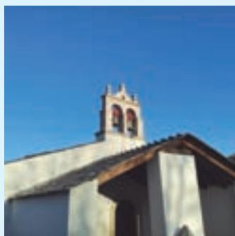
San Martiño de Lousada

Tamén se procedeu á consolidación das fábricas, tanto de muros como de arcos, para devolver a correcta funcionalidade estrutural ao inmobile; cambiáronse