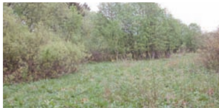
Finca de Paradela sen arranxar

De igual xeito, no interior do núcleo de poboación e na totalidade da franxa de protección de 50