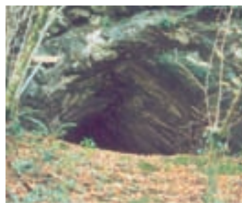
Imaxe da entrada á cova

O artigo demostra que as manifestacións artísticas de Cova Eirós amplían a distribución xeográfica e a continuidade cronolóxica da arte da