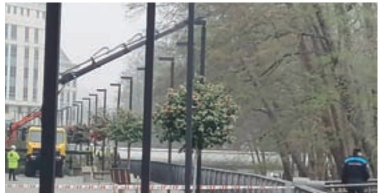
Arriba, un plano de Sarria e, abaixo, a zona da Ribeira

mos ou que supoñen un perigo, tanto pola súa inclinación como porque teñen á vista as raíces por mor da erosión da auga.