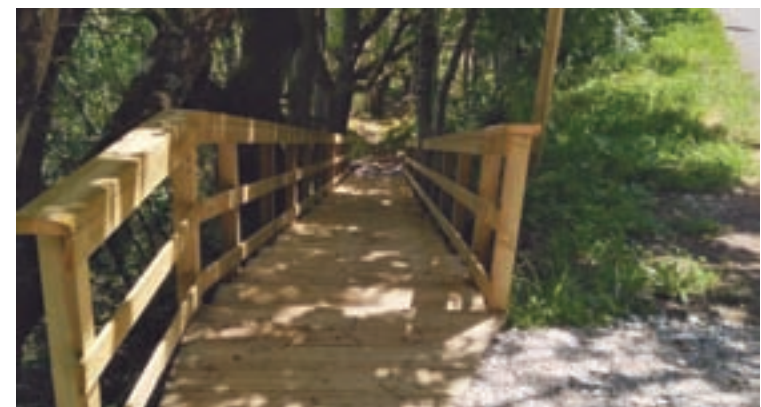
Imaxe do estado final dos traballos

O roteiro, que tiña actualmente uns 2,5 quilómetros de lonxitude permite facer un percorrido circular na que cada 17 de agosto se celebra a festividade deste santo. A ruta de San Mamede, que se habilitou no ano 2019, discorre pola serra do Oribio e ao longo do seu percorrido atópanse distintas construcións típicas da zona, como antigas alvarizas, que