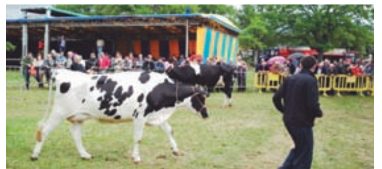
Fotografía de arquivo dunha das últimas edicións das Feiras

Máis concretamente, no río Neira, cuxo tramo de actuación comprende unha lonxitude total de 1 km, desde augas arriba do Sistema Automático de Información Hidrolóxica – SAIH- ata a desembocadura no río Miño, mellorarase a conectividade lonxitudinal do leito en todo o tramo de actuación; Tamén se retirarán aqueles tapóns illados que se atopan ao longo do mesmo. En todos os tramos, ademais, realízanse rozas selectivas de matogueira perimetral, poda e clareo de ramas baixas e curta sanitaria de pés secos para evitar tapóns en infraestruturas de paso; así como na retirada de residuos sólidos urbanos presentes no leito.