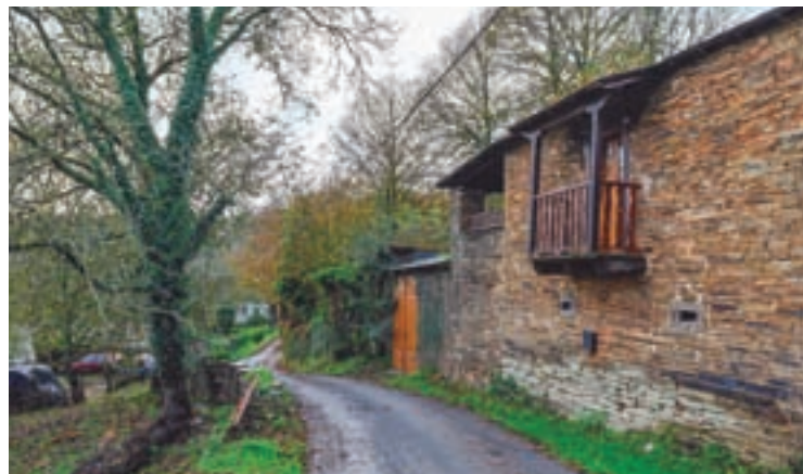
Unha vista da aldea modelo de Trascastro

O alcalde, Héctor Corujo, reuniuse co conselleiro do Medio Rural, José González, para avanzar no desenvolvemento do proxecto de aldea modelo de Trascastro, a primeira que se pon en marcha na provincia e unha das primeiras de Galicia.