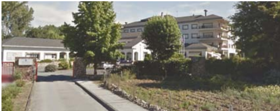
Imaxe do Centro de Atención a Persoas con Discapacidade