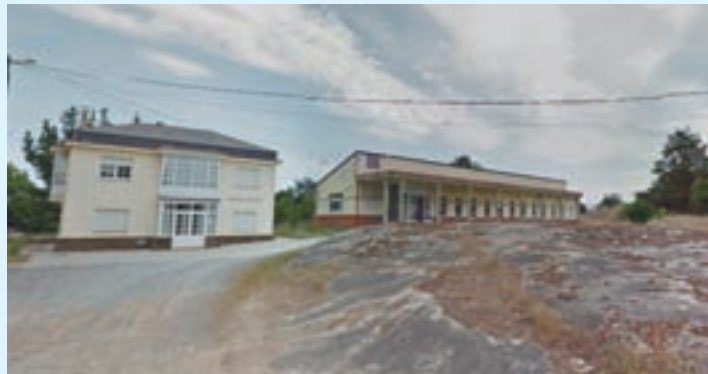
Lugar onde se construíría o anfiteatro

O Concello do Páramo segue a traballar no proxecto para a construción dun anfiteatro no pedo do campo da feira, co que pretenden poñer en valor a zona desde un punto de vista xeolóxico e turístico.