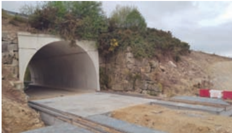
Obras da autovía entre Nadela e Sarria

AUTOVÍA. Por outra banda, estase a intensificar o ritmo da execución das obras da primeira fase de conversión