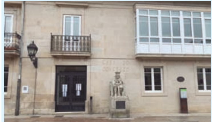
Casa do Concello de Sarria

A Deputación de Lugo vén de notificarlle ao Concello de Sarria a perda do dereito a cobro dos 17.666 euros cos que ía subvencionar o soterramento dunha liña eléctrica en Oural por non entregar a documentación correcta.