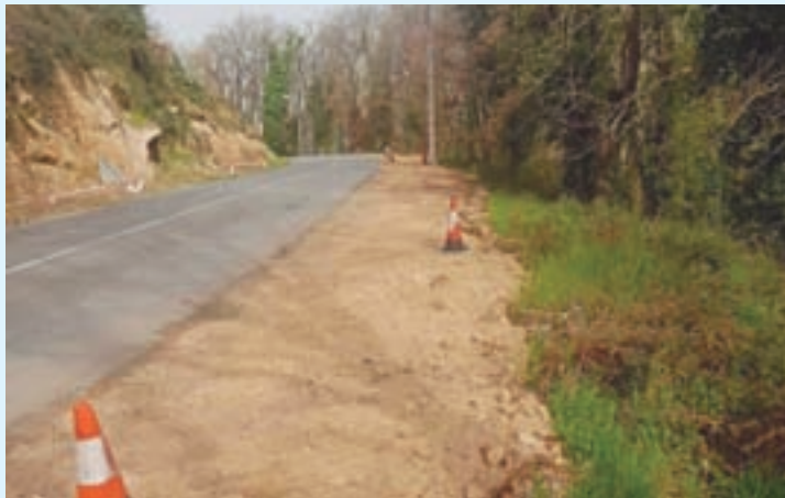
Imaxe da zona da estrada a Valdriz

As obras na ponte de Valdriz e a construción dunha glorieta na LU-621, en Láncara, seguen a bo ritmo, polo que está previsto comezar co ensanche da ponte a primeiros do mes que vén. Así, estímase que estarán rematados a finais de agosto.