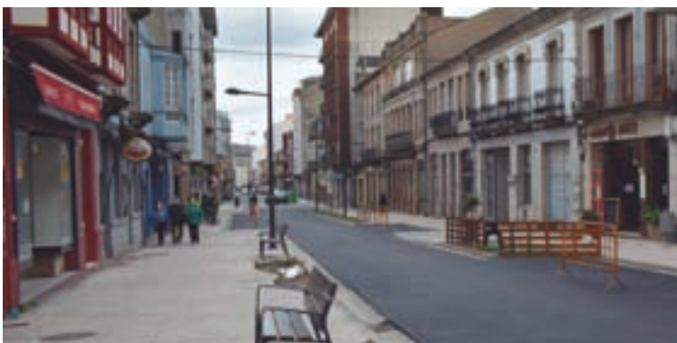
Unha imaxe da rúa Diego Pazos

O Parlamento de Galicia aprobou a proposición non de lei do Grupo Popular a través da que se require ao Concello a execución do proxecto de peonalización e mellora comercial da rúa Diego Pazos, segundo o proxecto técnico inicialmente presentado e que conta coa pertinente autorización autonómica, e no que se recolle unha actuación integral coa execución de beirarrúas, aparcadoiros e zona de circulación, así coma servizos, iluminación e mobiliario urbano.