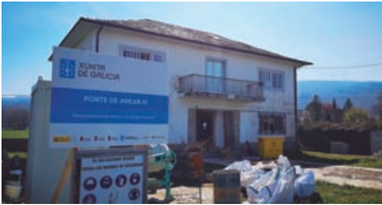
Imaxe do proceso das obras no consistorio