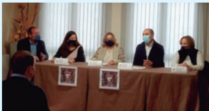
Un momento da presentación do proxecto

Esta iniciativa procura combater os efectos da crise no rural galego e reinventar o ecosistema turístico. Xeodestino Courel representa a unión de catro concellos a través dun novo destino turístico e com-