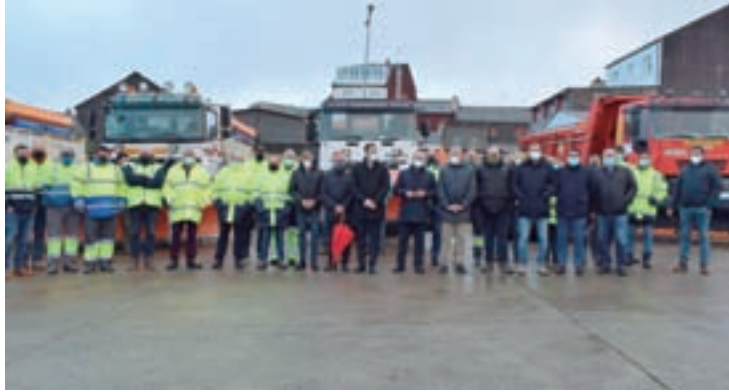
Presentación do Plan Invernal da Deputación

dese en 8 zonas, todas dotadas con medios suficientes para facer fronte coas maiores garantías posibles ás emerxencias que poidan xurdir. Dos 4.200 quilómetros de estradas, a metade están situados a máis de 600 metros de altitude sobre o nivel do mar, co que iso supón de maior incidencia das inclemencias meteorolóxicas.