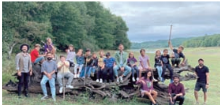
O grupo creativo do vídeo

‘DA MESMA RAÍZ’. Para iso, promoveron a gravación dun vídeo que hoxe mesmo dan a coñecer a través das redes sociais, protagonizado