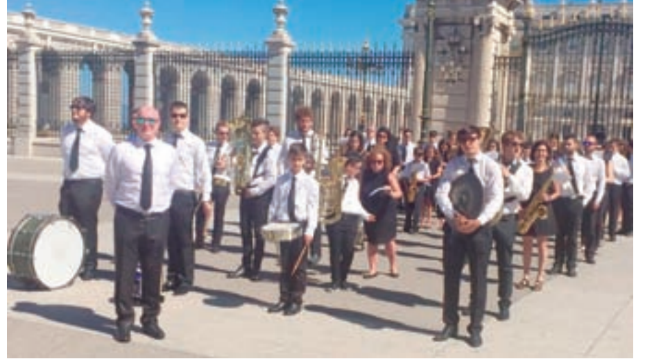
As artistas do grupo Rilo&Penadique, á esquerda, e a banda municipal de Sarria, á dereita. As dúas serán actividades previstas na programación de Nadal da comarca