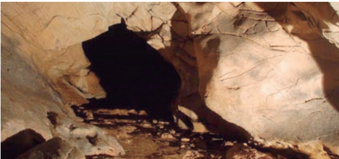
Vista do interior da cova

En Cancelo tamén se atopa a Igrexa de San Cristovo de Cancelo que conta con pinturas do século XVI. As pinturas representan a Última Cea e varios pasaxes da Paixón de Cristo.