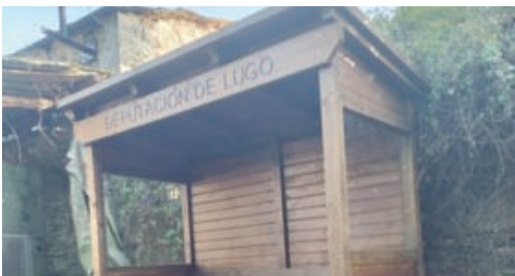
A marquesiña de Aguiada

O PP de Sarria levará ao seguinte pleno unha moción pola marquesiña instalada no lugar de Aguiada, parroquia de Calvor.