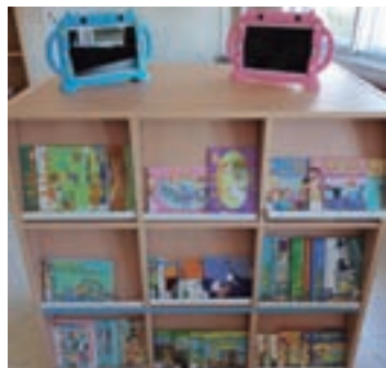
O novo material do colexio

AULA MULTIUSOS. O Concello de O Incio vén de recibir unha subvención da Consellería de Cultura,