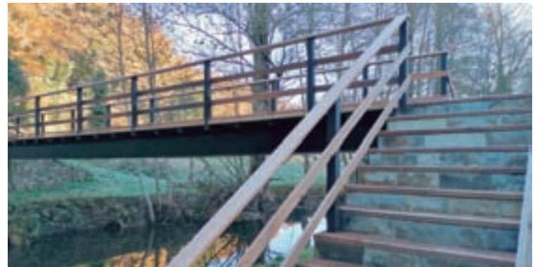
Novas pasarelas no río Samos

Estas vías dotan aos veciños e peregrinos de seguridade á hora de realizar un paseo polo río, fomentando o exercicio e a vida saudable. As obras enmárcanse no programa de melloras do Concello na que tamén se atopan as recentes obras da biblioteca onde se cambiaron portas, ventás e cuberta. As obras da biblioteca contan