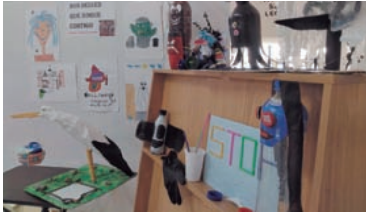
Dúas imaxes dos traballos realizados a prol da cultura ecolóxica

O Concello procederá ao pintado dun tramo da vía cando mellores as condicións meteorolóxicas pero a circulación manterase sen cambios.