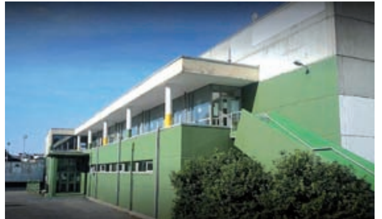
O pavillón José Mario González

A actuación consistirá na substitución do pavimento actual por un pavimento multideportivo arealástico deseñado para a instalación en recintos interiores polideportivos de uso intensivo.