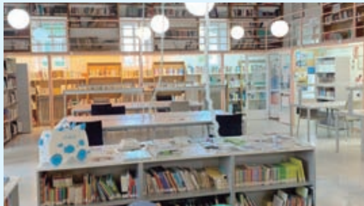
Biblioteca de Sarria

zada no ano anterior na sala de estudos da planta baixa que na actualidade conta con capacidade para 50 persoas.