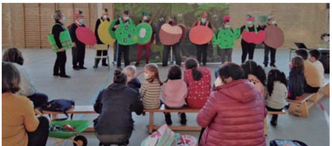
Os Bolechas aterraron no Incio para facer rir aos máis pequenos