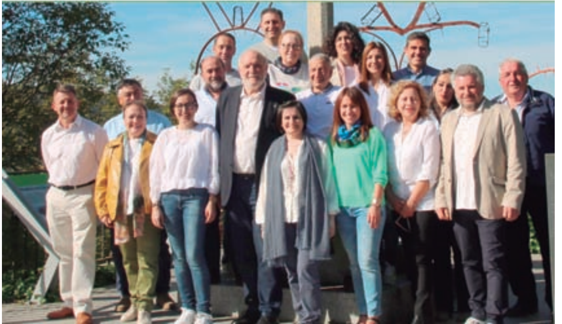
Grupo electoral Camiña Sarria, que está á fronte do Concello

“A remodelación e limpeza das pistas e rúas principais reflicte o compromiso que temos para garantir unhas condicións dignas e seguras para os cidadáns”