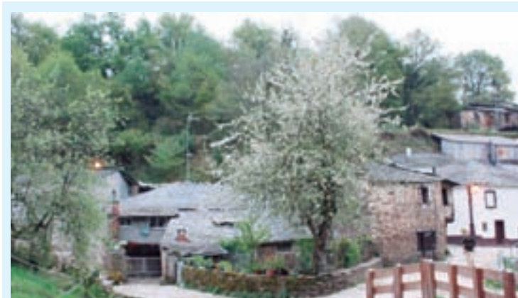
Núcleo urbano da Balsa