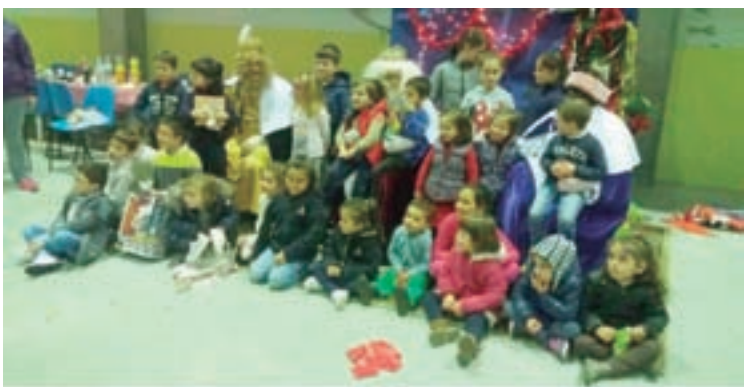
Arriba, alumeado en Triacastela e, abaixo, a asociación de Paradela

Paradela visitarán a Residencia de Maiores para entregarlles aos avós un roscón de Reis. A continuación farase a entrega dos agasallos aos nenos que tamén poderán realizar fotografías coas Súas Maxestades os Reis de Oriente.