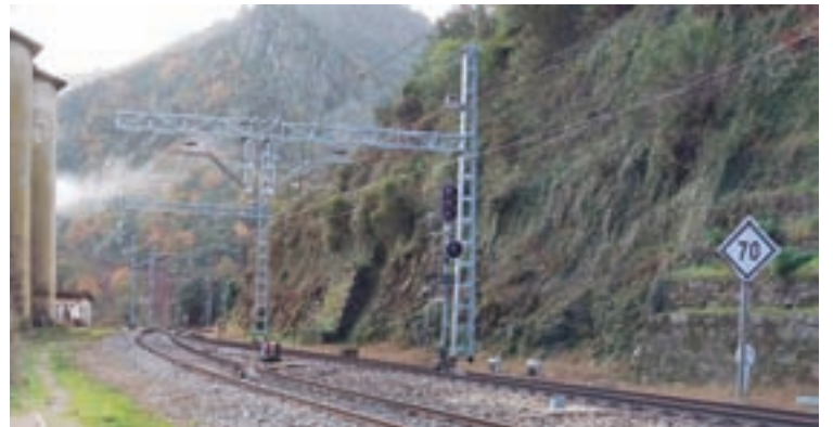
Vía férrea de Sarria a Monforte

“Coa temática desta edición pretendíamos poñer en valor, dar a coñecer e divulgar o patrimonio natural e cultural destas Reservas da Biosfera que xestiona a Deputación, e que son unha das ferramentas importantes para o desenvolvemento da provincia”, explicou García Porto. A temática incluía, tanto redes de rutas de sendeirismo e itinerarios, como o conxunto de vías e camiños tradicionais, co obxectivo de amosara riqueza natural, cultural e paisaxística das reservas Terras do Miño e Os Ancares Lucenses.