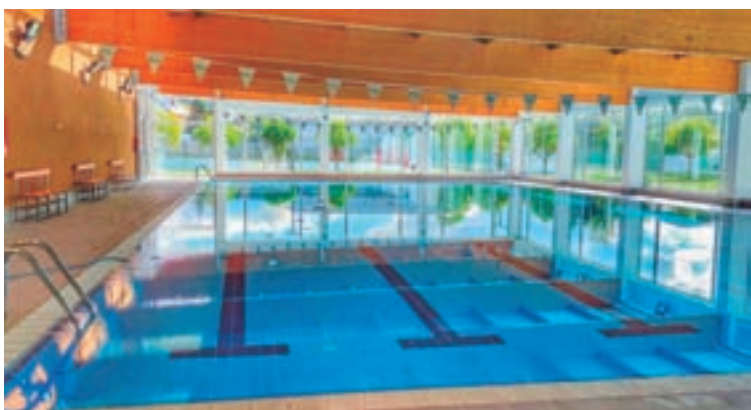
A piscina climatizada construíuse no ano 2012