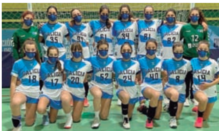
Os distintos equipos participantes no torneo de Sarria