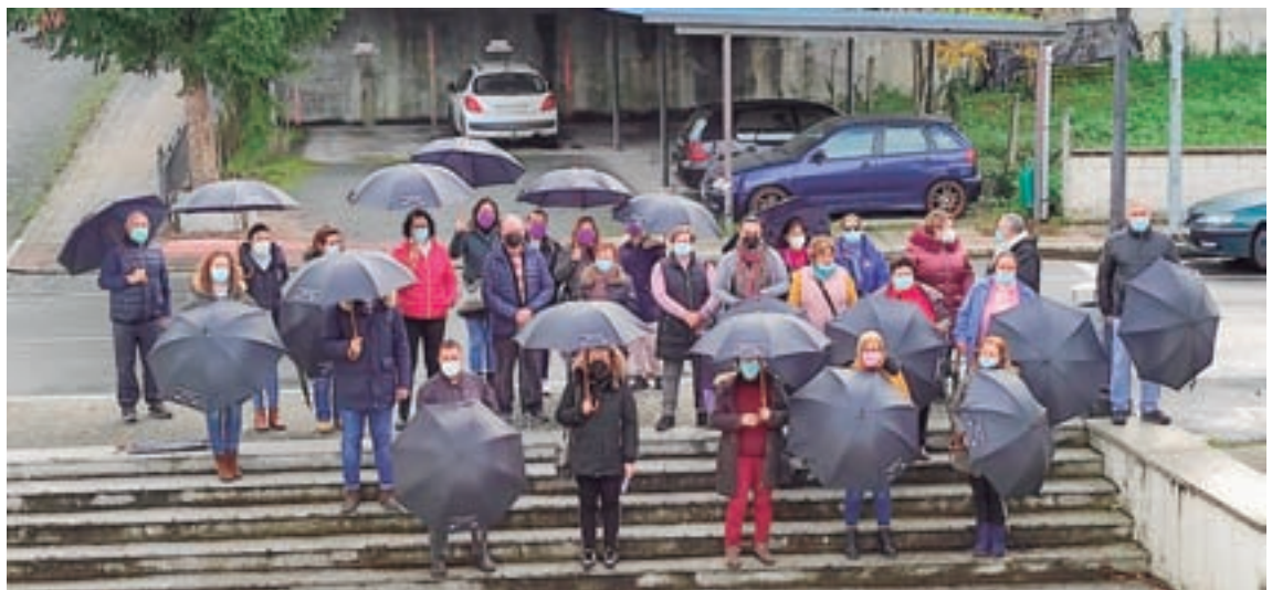
Diferentes momentos que o 25N deixou na comarca