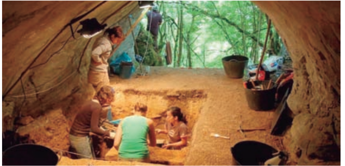
Un grupo de arqueólogos traballando no interior da cova

SECUENCIA ESTRATIGRÁFICA. A secuencia estratigráfica descrita no xacemento pódese estruturar no nivel superficial que é terra orgánica moi solta e fortemente bioturbada. Esta presenta restos da calcaria froito dos desprendementos do teito. Neste nivel identificouse un empedrado perimetral que delimita o espazo de dous silos medievais. O nivel B da cova sería de matriz limosa de cor amarelo esbrancuxado, compacto e onde se encontran gravas angulosas de calcaria. Na parte inferior deste nivel identifícase unha capa de sedimento moi orgánico de cor escuro. Nesta capa recuperouse moito material arqueolóxico. E o nivel C que é de matriz arxilosa moi