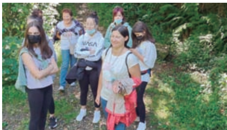
Imaxes de dúas das actividades organizadas pola asociación de Mulleres Rurais