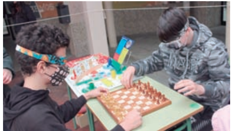
Unha das actividades no Día da Discapacidade

xogaron ó xadrez en ausencia de visión, puxeron a proba a orientación, memoria e atención, vestíronse e comeron cunha soa man, pintaron cos pés e desprazáronse con cadeira de rodas e coa axuda de diferentes bastóns. A maiores puideron experimentar distintos deportes adaptados como Boccia, baloncesto en cadeira de rodas, escalada a cegas e Goalball. Unha mañá chea de reflexións sobre o dereito a igualdade de oportunidades das