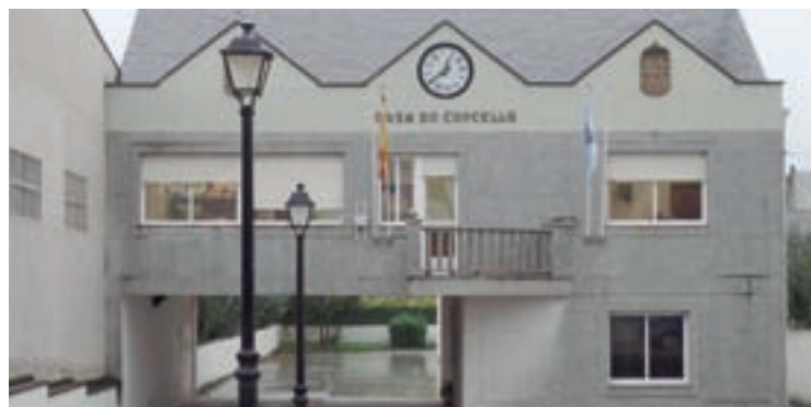
Concello de Láncara

O grupo popular que se opuxo a aprobación destas contas destacou que nestas partidas non se contempla o apoio ao sector gandeiro,