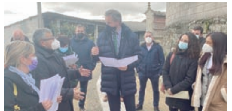
Visita do delegado do Goberno ao lugar de Pena

CAMIÑO. Este programa componse de 10 proxectos que se desenvolven en 10 concellos das provincias de