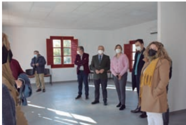
Visita do presidente da Deputación á antiga escola

Esta reforma supón unha mellora nas infraestruturas de reunión e realización de actividades para a Asociación Cultural Val de Láncara que fomenta a xuntanza dos veciños co obxectivo de facer parroquia.