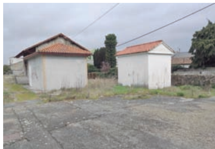
Á esquerda, o plano do proxecto e, á dereita, dúas imaxes dos terreos