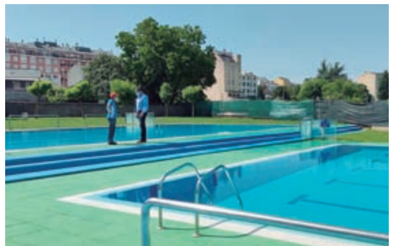
Piscina exterior de Sarria

Desta forma, estarase a promover a educación física a través de diferentes tipos de actividades deportivas, centradas en diferentes perfís de usuarios; desde actividades deportivas de iniciación a natación centrada na idade infantil, actividades educativo-deportivas inculcando una serie de valores positivos e estilos de vida saudables, actividades de natación de mellora técnica a un nivel o deporte con outro tipo de actividades físicas ou deportivas que se poden levar a cabo nas mesmas instalacións como a natación terapéutica, natación para mulleres embarazadas, para persoas en idade avanzada, e outro tipo de actividades como ioga, pilates, actividades de baile, traballo de