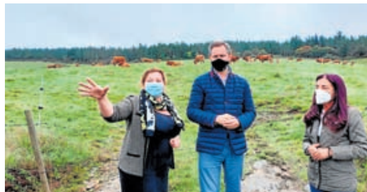
Visita do delegado do Goberno á comarca

A repartición levouse a cabo en consonancia cos acordos da Administración Xeral do Estado e as comunidades autónomas para o financiamento dos programas de desenvolvemento rural do período