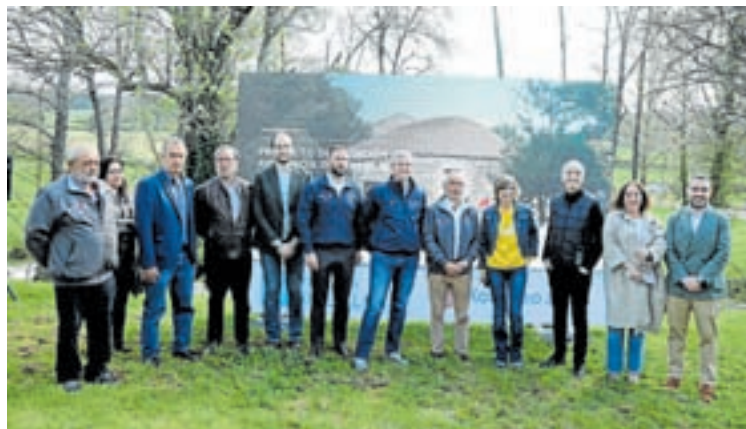
A presentación do proxecto Pilgrim

O sistema de medición pretende ser complementario as estadísticas de Compostelas seladas na Oficina de Acollida ao Peregrino.