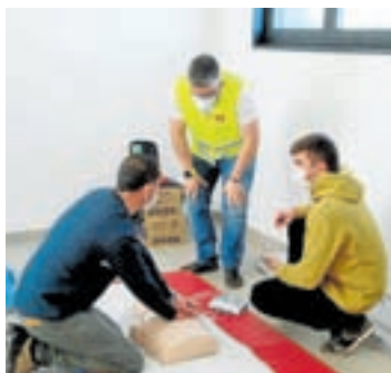
Curso de Protección Civil

O Incio acolleu un curso de soporte vital básico para voluntarios de Protección Civil, unha formación fundamental para proporcionar maior seguridade ante calquera tipo de emerxencia relacionada cos paros cardíacos. Ante un paro cardíaco cada minuto conta, por iso, saber utilizar un desfibrilador semiautomático externo pode ser a diferenza entre a vida e a morte. Malia que o desfibrilador é moi fácil de manexar, ter unha formación guiada por persoal experto e as conseguíntes prácticas con simulacións é a única forma de familiarizarse cos pasos e aprender a controlar a situación e os nervios nunha situación de verdade. A morte súbita ou parada cardíaca é un problema que ocorre de maneira inesperada e con relativa frecuencia en España. O 80% dos casos suceden en domicilios ou na vía pública e tan só é posible axudar de forma inmediata co uso do DESA por parte dos testemuñas ou primeiros intervinientes. O recoñecemento rápido