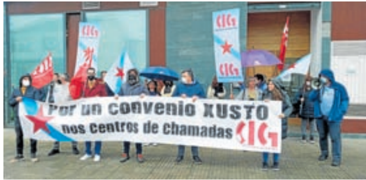
Concentración de traballadores de centros de chamadas

“A patronal quere consolidar a miseria e a precariedade laboral” En canto ás negociacións do convenio (que é de ámbito estatal), Cordo denunciou que a patronal pretende consolidar os baixos salarios e a precariedade, presentando unha proposta económica de miseria: do