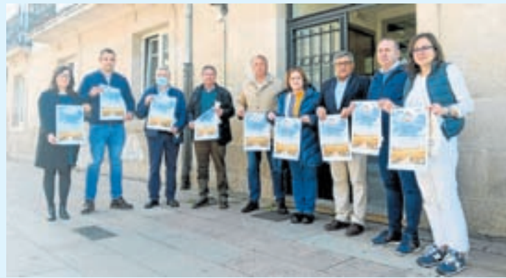
Acto de presentación da iniciativa

O reto consiste en levar a cabo pequenas accións ao longo do Camiño de Santiago que axuden a conseguir un futuro mellor. Apostando por un consumo responsable, que sexa respectuoso co medio ambiente pero tamén solidario cos territorios e as persoas do planeta.