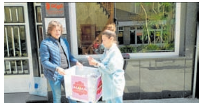
Un momento do sorteo do Día da Nai

As tres premiadas obtiveron a súa participación neste sorteo especial con motivo da campaña do Día da Nai ao faceren as súas compras en establecementos adheridos á Asociación de Comerciantes, Empresarios, Profesionales y Autónomos de Sarria entre o 19 de abril e o propio 1 de maio. Nesta ocasión as compras das premiadas foron realizadas en: Mercería Lucía, Electronova e Los Sueños de Uxía.