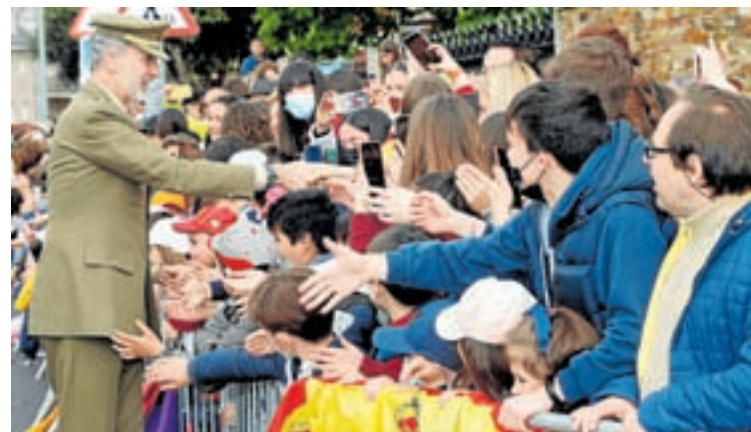
O Rei Felipe VI, en dúas imaxes da súa visita a Sarria para coñecer o Camiño de Santiago e o Cuartel da Garda Civil

A visita ao cuartel da Garda Civil, onde traballan 20 axentes, serviu para explicar e visualizar a través dunha exposición os labores que realiza o corpo de seguridade en canto ao Camiño de Santiago.